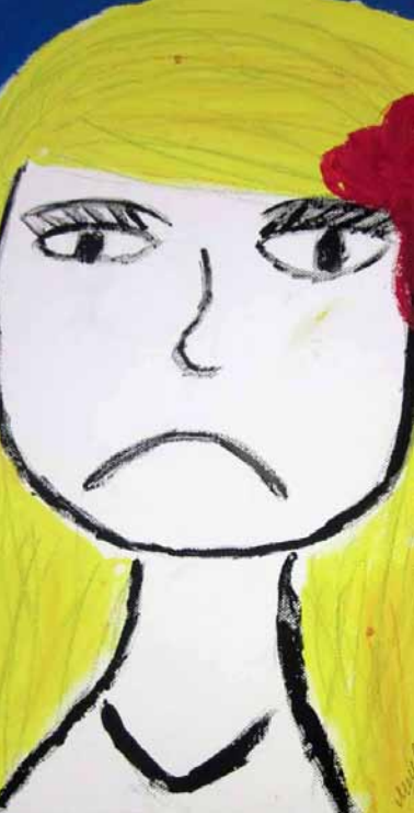
Marem Magomadova, Selbstportrait 1 Acryl/Lwd., 2012