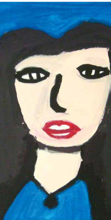
Heda Sapaewa, Selbstportrait 1 Acryl/Lwd., 2012