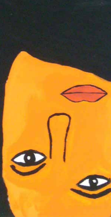
Fatma Sar, Selbstportrait 1 Acryl/Lwd., 2012