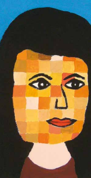
Fatma Sar, Selbstportrait 2 Acryl/Lwd., 2012