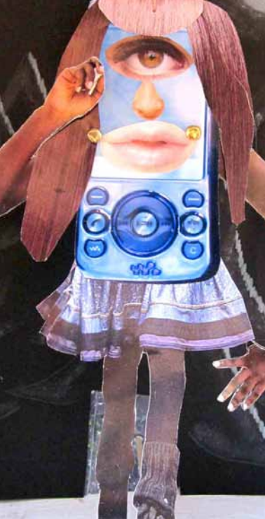
Kilsy, o.T. Kartonmarionette, 2010