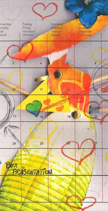
Pia M., Sonnenlampe Collage, 2010